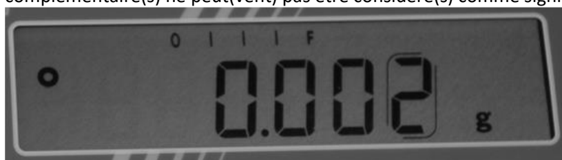
Figure 1 : Affichage différencié de l'échelon d'affichage "d"

Si "d" est différent de "e", l'affichage doit être différencié (couleur, hachures, parenthèses) pour attirer l'attention sur le fait qu'il n'est pas une unité garantie (voir Figure 1). Ce(s) chiffre(s) complémentaire(s) ne peut(vent) pas être considéré(s) comme significatif(s).